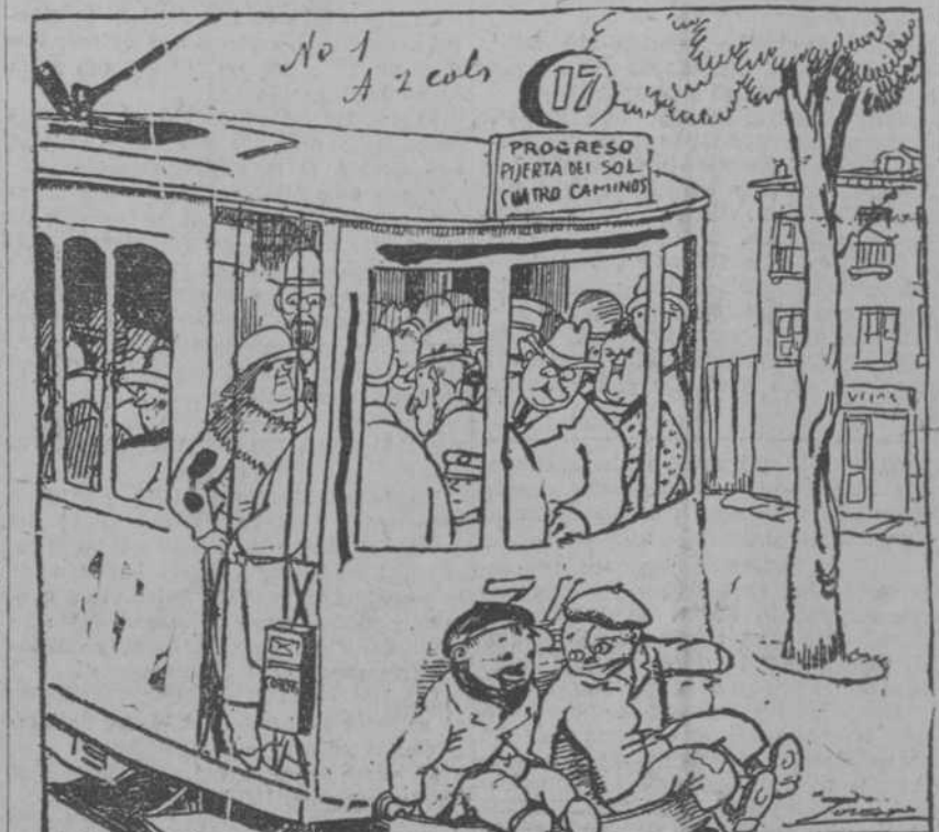
El tranvía de la Puerta del Sol. Fue este así hace cuarenta años. Hoy sigue siendo. Pero antes era Madrid poco más o menos una villa de doscientos mil habitantes; cuenta en cambio ahora con una población que rebasa los novecientos mil...

EL DIRECTORIO QUISO INTENSIFICAR Y DESCONGESTIONAR EL SERVICIO... PERO HA TENIDO EN LA PRÁCTICA QUE DEJAR SIN EFECTO SU "REAL ORDEN". Por el DR. LORENZO FRAU MARSAL (De nuestra Redacción en Madrid).