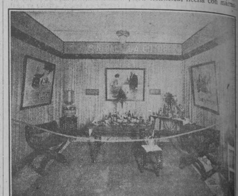
INSTALACION DEL AGUA LA COTORRA EN LA FERIA MUESTRARIO.

El agua La Cotorra, que en tan pocas mesas falta, no podía dejar de concurrir a la Feria Muestrario.