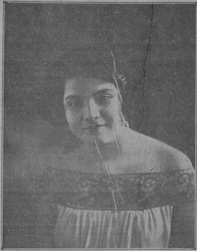
Como es sabido, nuestro colega "La Política Seria", ha organizado un concurso nacional para elegir, por votación popular, Reina del Carnaval.