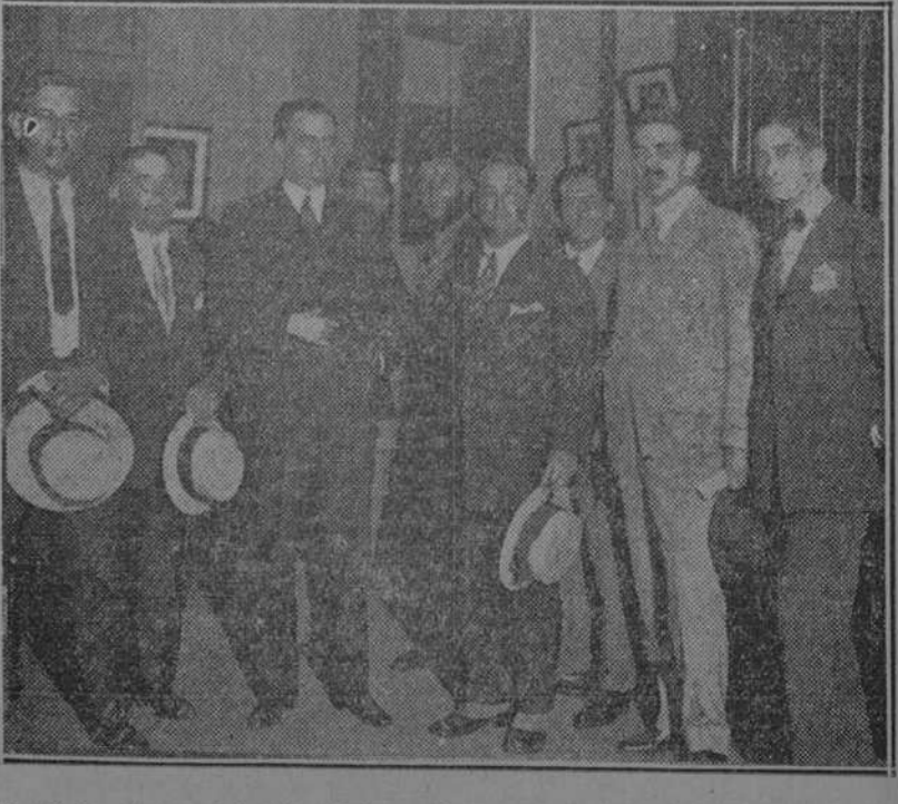
El célebre tenor Hipólito Lázaro durante su visita al DIARIO, donde fué cortés y cordialmente atendido por el Conde del Rivero, presidente de la Empresa.