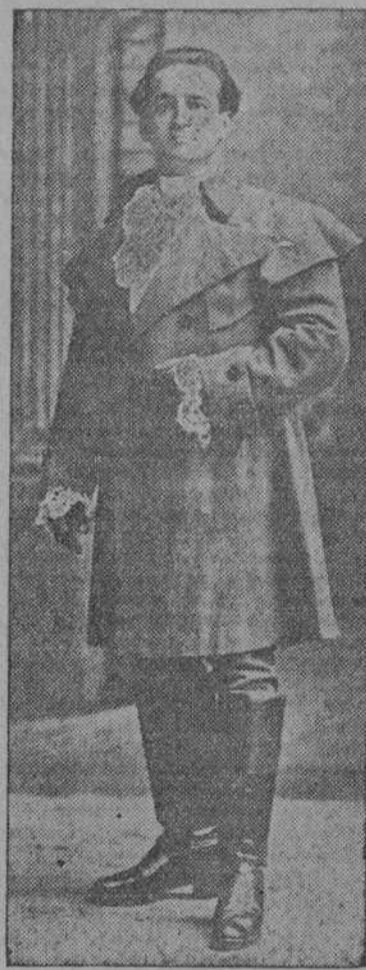
HIPOLITO LAZARO el "tenor de la época", nuestro huésped desde ayer

Ta tenemos al "divo" en nuestra casa. Cese la desconfianza de los que dudaban que Lázaro, reclamado por todas las empresas del mundo con ventajosas contrataciones, accediera a las proposiciones del empresario Sr. Polón para actuar en la Habana. Desde ayer se encuentra Lázaro entre nosotros augurando con sólo su llegada una brillante temporada lírica.