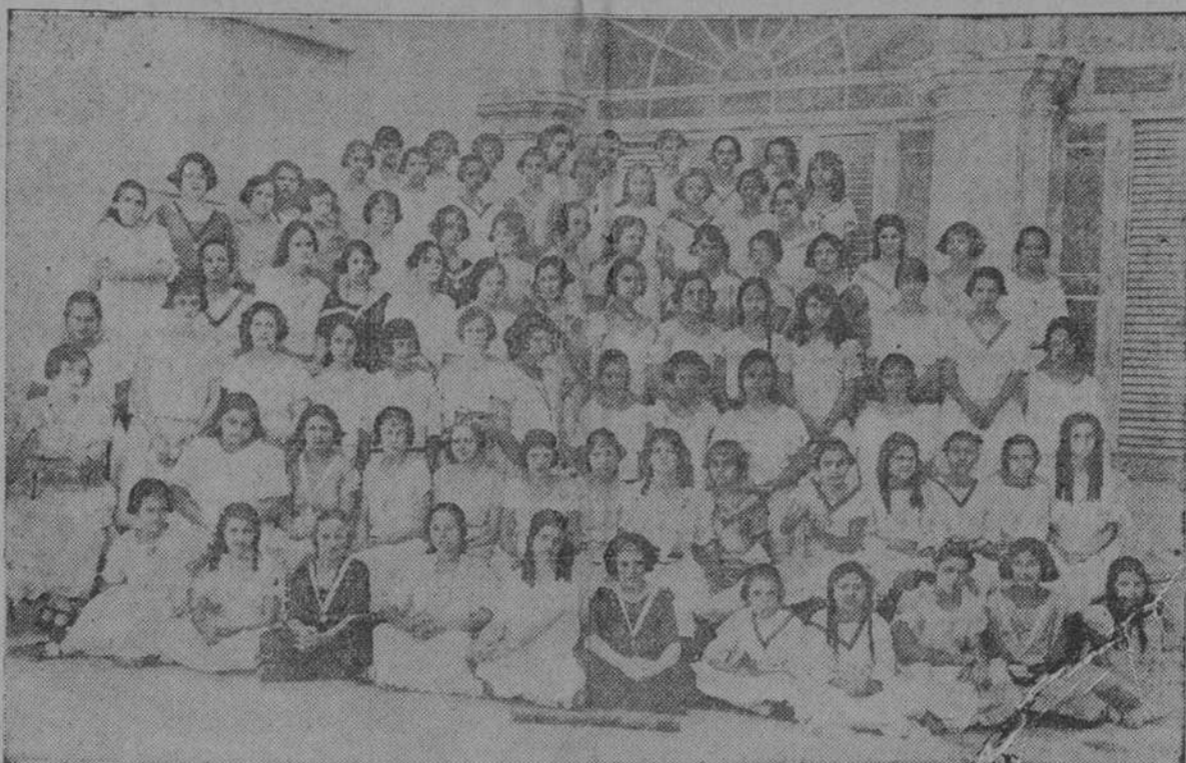
GRUPO DE LAS HIJAS DE MARIA