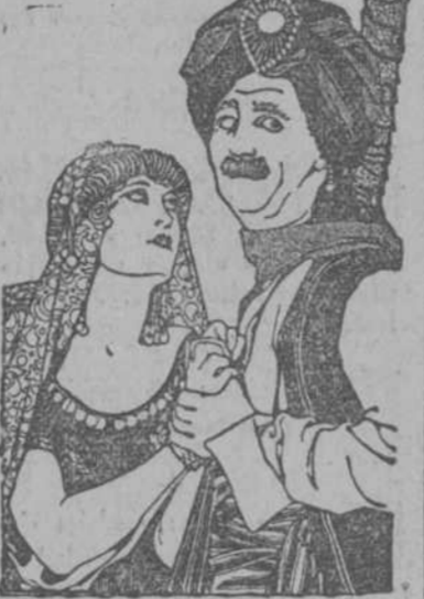
Titulada: EL JEQUE DE ARABIA EN JAQUE (The Shriek of Araby)