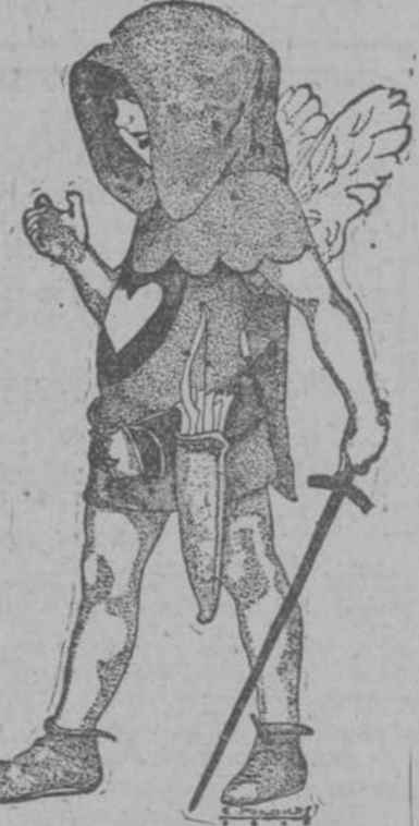
TODOS POR EL AMOR La obra premiada en París. c4935 14-29