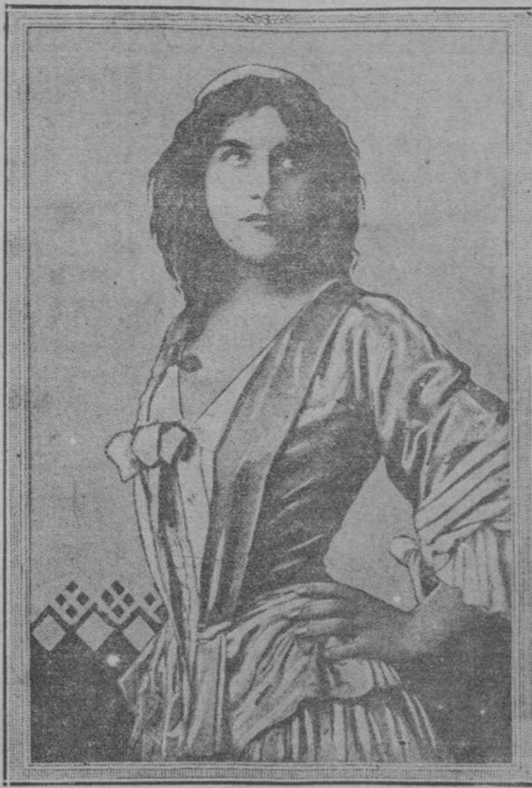
FARRAR EN MANON

Pocas cantantes disfrutan en el mundo entero, de la justa y merecida fama de que goza GERALDINE FARRAR, en París, Berlín y New York, han sido teatro de los clamorosos triunfos de esta verdadera "diva" del "bel canto".