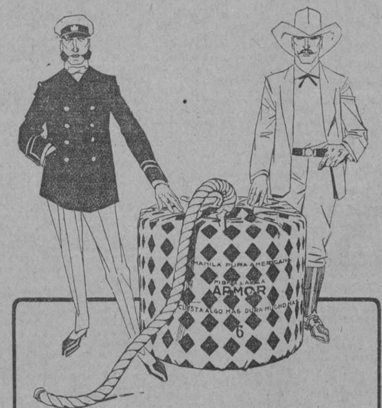
LOS MARINOS Y AGRICULTORES INTELIGENTES

Preferen la Manila americana marca ARMOR porque siendo la más cara resulta la más barata por su gran resistencia y duración.