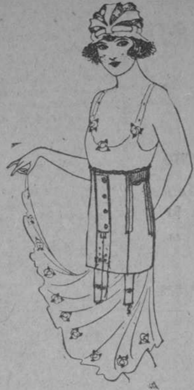
Modelo de corsé Bon Ton para jovencitas y niñas. Es de cuti liso con dos secciones de elástico...