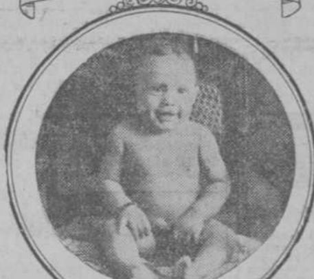
Leonor Feo, 6 meses, 19 libras.