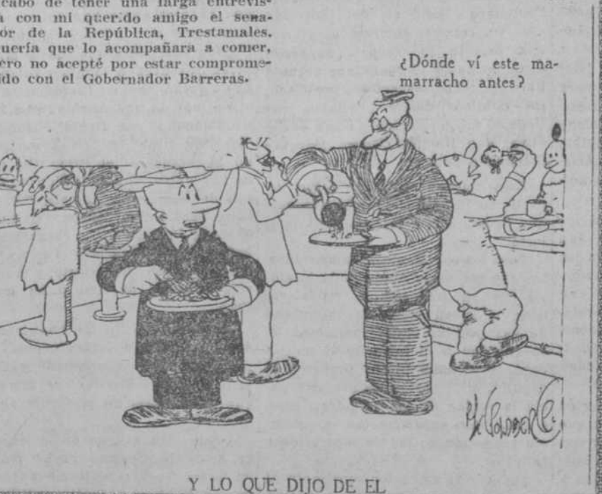
Y LO QUE DIJO DE EL