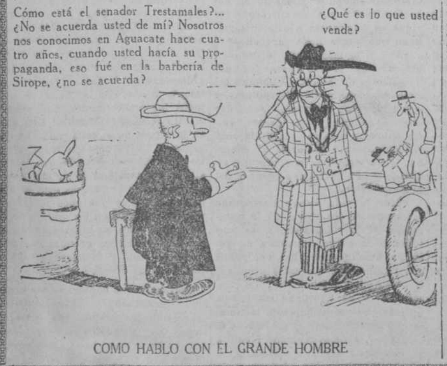
COMO HABLO CON EL GRANDE HOMBRE