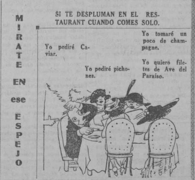
SI TE DESPLUMAN EN EL RESTAURANT CUANDO COMES SOLO.