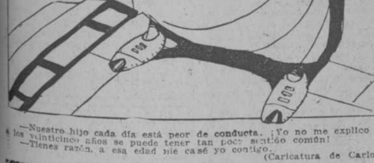
PASANDO LA VIDA

Pero cuatro mil millones, aunque sean de francos en Cuba, es cosa que no se comprende sino a puñaladas. Cuando el periodista, que es uno de los seres más nocivos de la creación, no sabe qué inventar para atribuirlo al americano del Norte, busca una india occidental y mal famosa para hacerla cómplice de una pésimos novela. Suponer que una herencia de ciento cincuenta millones se estaba ahí, sin propietarios, creciendo hasta llegar a cuatro mil millones, es cosa tan cándida como inocencia demuestra el que no conoce la idiosincrasia de los individuos tropicales. Los que han visto que aún no había pasado sus cincuenta mil pesos el