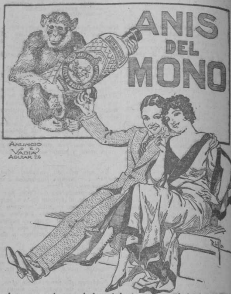
Los que sabemos beber Anis tomamos "Anis del Mono"

definitiva y, llenado este requisito, se procederá a la ejecución de la obra.