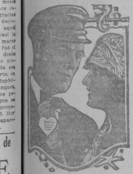
Thomas Meighan y Agnes Ayres en la película "The Beauty Shop"