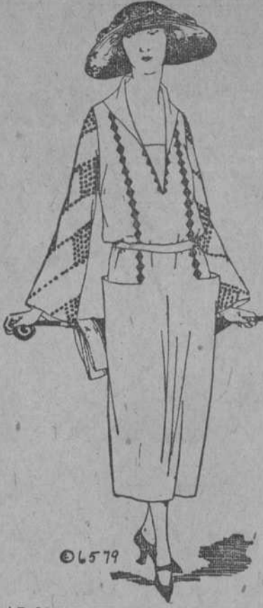
LAS MANGAS INFLUYEN MUCHO EN LA SILUETA