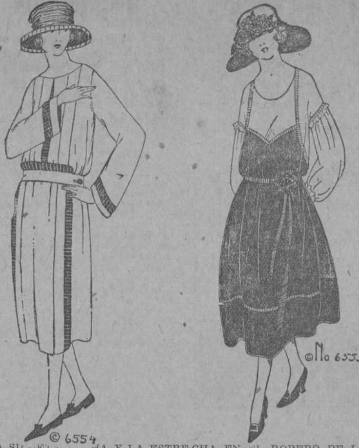
LA SILUETA ANCHA Y LA ESTRECHA EN EL ROPERO DE LA JOVENCITA