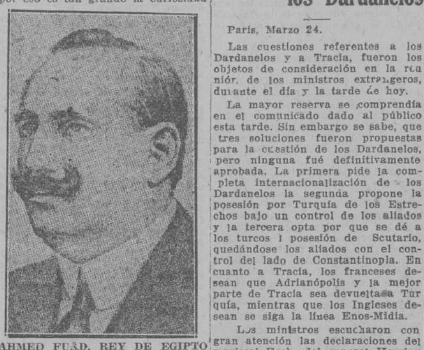
AHMED FUAD, REY DE EGIPTO

Ha cabido en suerte al nuevo Rey de Egipto, Ahmed Fuad Baá, el restablecer la monarquía egipcia de los reyes faraónicos, y aun pudiera decirse que durante catorce siglos han luchado después los mahometanos contra los cristianos en esos mismos territorios como en otros de Europa y Asia; y también ha tenido la suerte ese nuevo monarca egipcio de haber obtenido por las artes de la paz, y no por la insurrección ni por las armas, el restablecimiento de la monarquía egipcia. Por otro concepto, también de naturaleza histórica, está llamando la atención el territorio próximo a Egipto entre Tripoli y la delta del Nilo, que es donde estaba asentada la antigua Cartago. Hoy se sabe ya cual es el sitio donde está enterrado Anibal llevado al sepulcro como señal de respeto y veneración por los turcos, con toda la armadura que usaba en las batallas, y por eso es tan grande la curiosidad