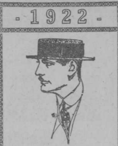
Los Elegantes prefieren nuestros