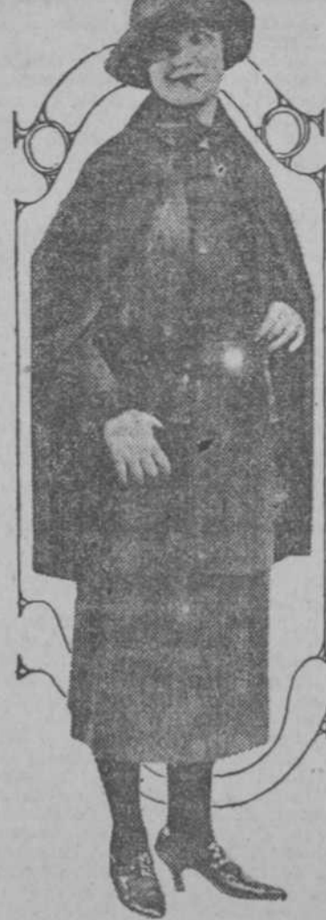
Abrigada con la capa tan en boga actualmente, esta dama se pasea por el simpático Broadway. La tela es de nueva creación y es conocida por "traineine"

de la suscripción entre los comerciantes, industriales y vecinos de esta localidad y producto de la función efectuada hace pocos días en el teatro "Ilusiones". Es lástima que en esta Villa no se haya recaudado ni siquiera mil pesos habiendo tantos españoles acudidos.