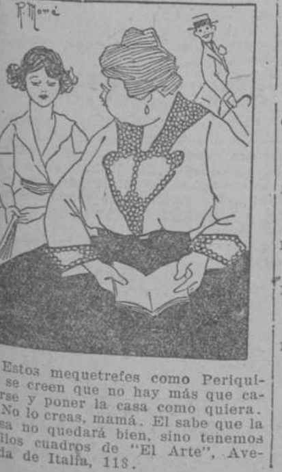
Estos mequetrefes como Periquito se creen que no hay más que casarse y poner la casa como quiera. No lo creas, mamá. El sabe que la casa no quedará bien, sino tenemos bellos cuadros de "El Arte", Avenida de Italia, 118.

LA MAYOR DEL MUNDO 17 VIDRIERAS. UNA CUADRA DE LARGO DEPARTAMENTO DE SEÑORAS BELASCOAIN Y ZANJA DEPARTAMENTO DE CABALLEROS BELASCOAIN Y SAN JOSE Teléfonos M-5874 y M-6514