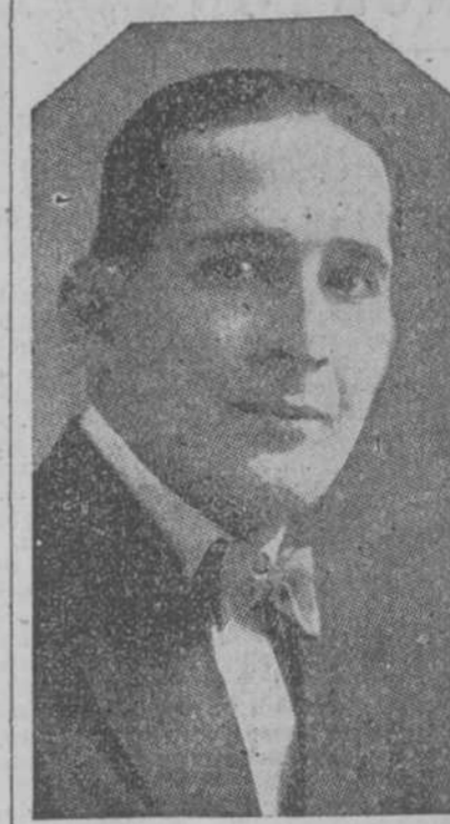
El baritono cubano ABELARDO GALINDO.