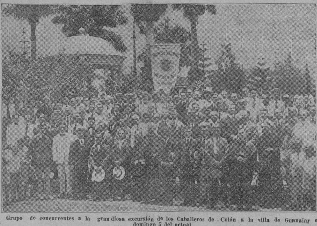
Grupo de concurrentes a la grandiosa exersión de los Caballeros de Colón a la villa de Gunnajay el domingo 5 del actual

¡A lo que queda reducido ante unas copas de vino y unas cuantas niñas casquivanas!