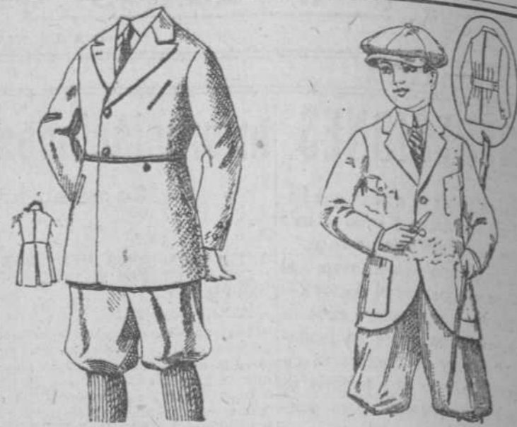
Trajes de dril de color, a $4.00. Trajes de dril blanco, a $5.00. Para niños de ocho a catorce años.