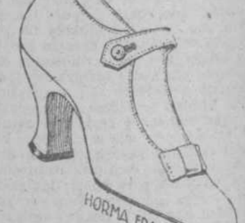
HORMA FRANCESA CORTA

Todos estos modelos los tenemos en pieles de Austria, Glacé blanco, cristal, piel lavable y Gamuza, también con Luis XV, y medio XV.