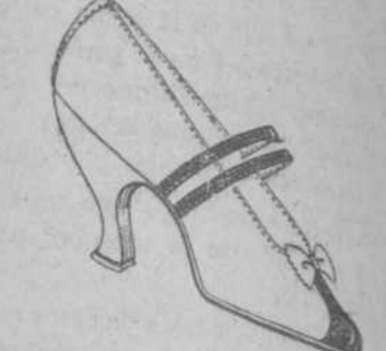
Precioso estilo en Glacé blanco y Charol.

Son las que acabamos de recibir para la presente Estación