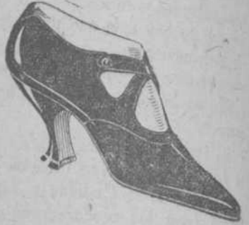
Pieles blancas y Gamuzas.