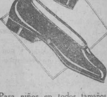
Para niños en todos tamaños y pieles, correas cruzadas también