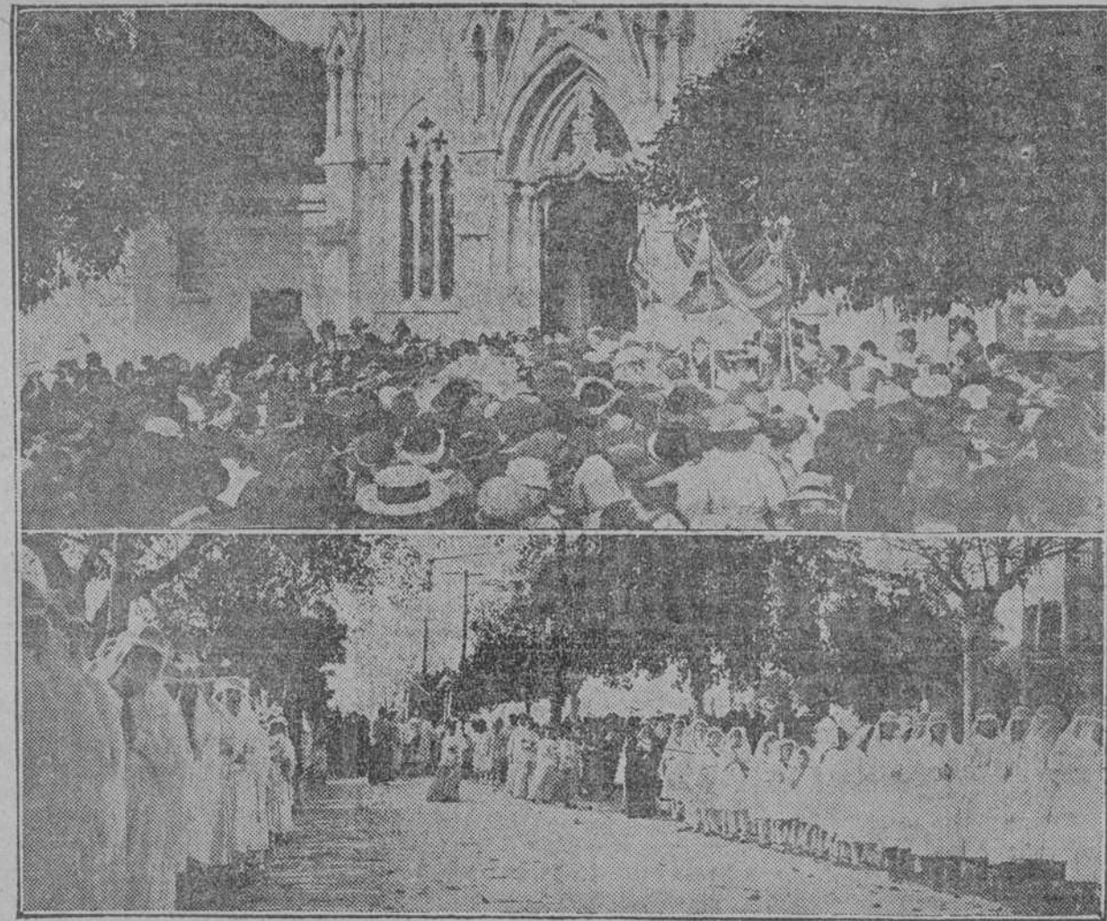
DOS ASPECTOS DE LA PROCESION DEL SANTISIMO EN EL TRASLADO DE LA CAPPILLA A LA IGLESIA