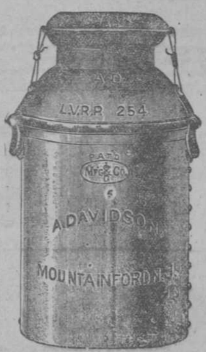
TARROS PARA LECHE, DE TODOS TAMAÑOS

DESECO COLOCARSE UN CHIAPO DE mano, en casa particular, con referencias de las casas que trabaja, sabiendo todo lo concerniente a un servicio fino y cumplido. Dirección: Las Delicias, Teléfono F-1040. 10 f