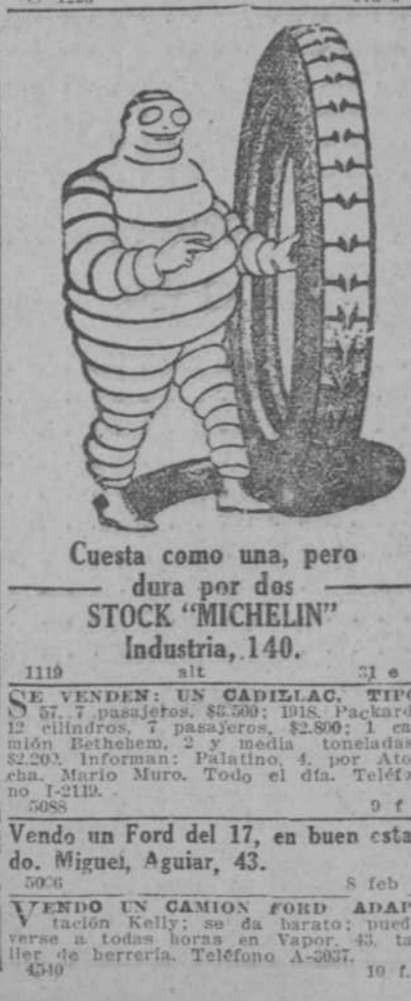
Cuesta como una, pero dura por dos STOCK 'MICHELIN' Industria, 140. 1119 21 e

VENDO UN FORD EN BUENAS condiciones; se vende a $1,000. Información: esquina a Vapor, Tiro de Cerro. 10 f