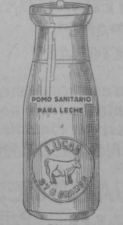
POMOS SANITARIOS PARA LECHE LA CUBANA VIRTUDES, 97. Teléfono A-5442