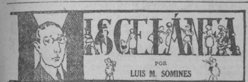
MISCELANEA POR LUIS M. SOMINES