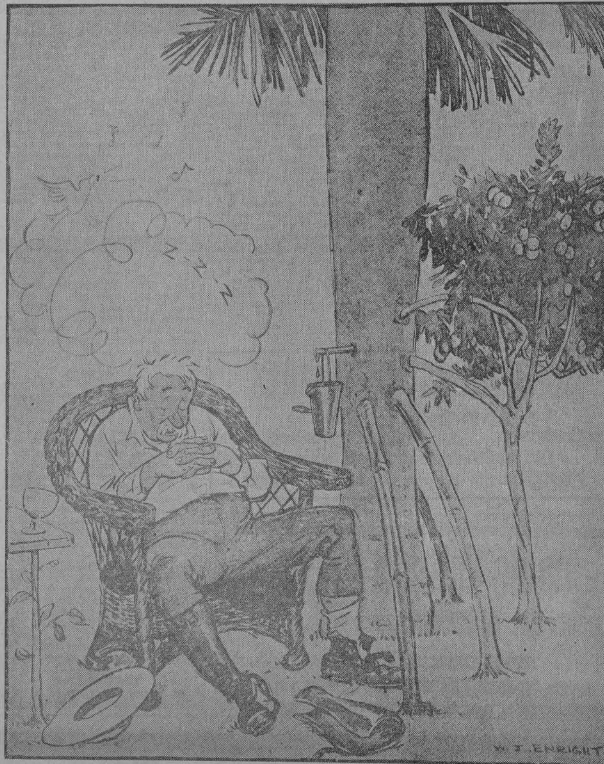
Dedique un pensamiento a Cuba.

Un hacendado durmiendo la siesta a la sombra de un árbol "Bacardi", al que se le ha ingeritado una caña de azúcar y un limonero.