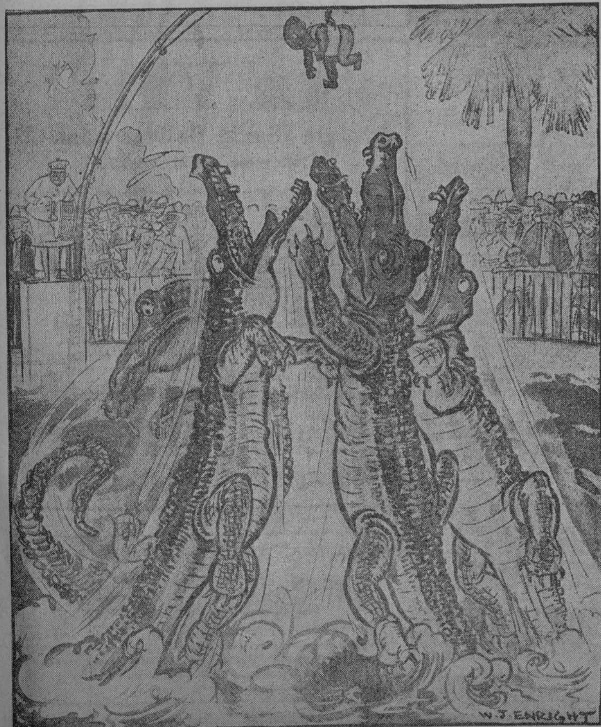
Dedique un pensamiento a Cuba.

Ejercitando a los caimanes en el Jardín Zoológico de Santiago de Cuba.