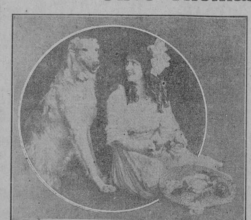
La actriz Olive Thomas en una de sus últimas fotografías