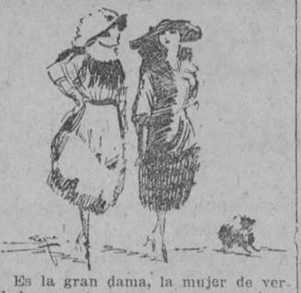
Es la gran dama, la mujer de verdadero gusto, que recorta y pule y

"Hay una moda que no es precisamente la que vemos en casa de los grandes modistos, y que quizá sea la verdadera moda parisiense. El modisto que necesita imponer una silueta determinada, ha de exagerarla necesariamente, y traza con vivos colores aquello que más tarde hemos de adaptar a nuestra figura, a nuestra edad, a nuestros medios. . . . Vemos así que las sayas se hacen algo más largas y que las espaldas desnudas se cubren de tules.