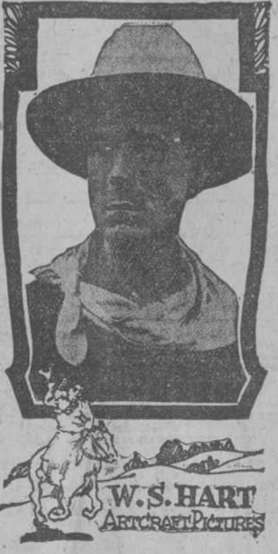
W.S. HART ARTCRAFT PICTURES

Lunes y Martes, Estreno: ARIZONA, o EL PUNDO NOR MILITAR, por Douglas Fairbanks.