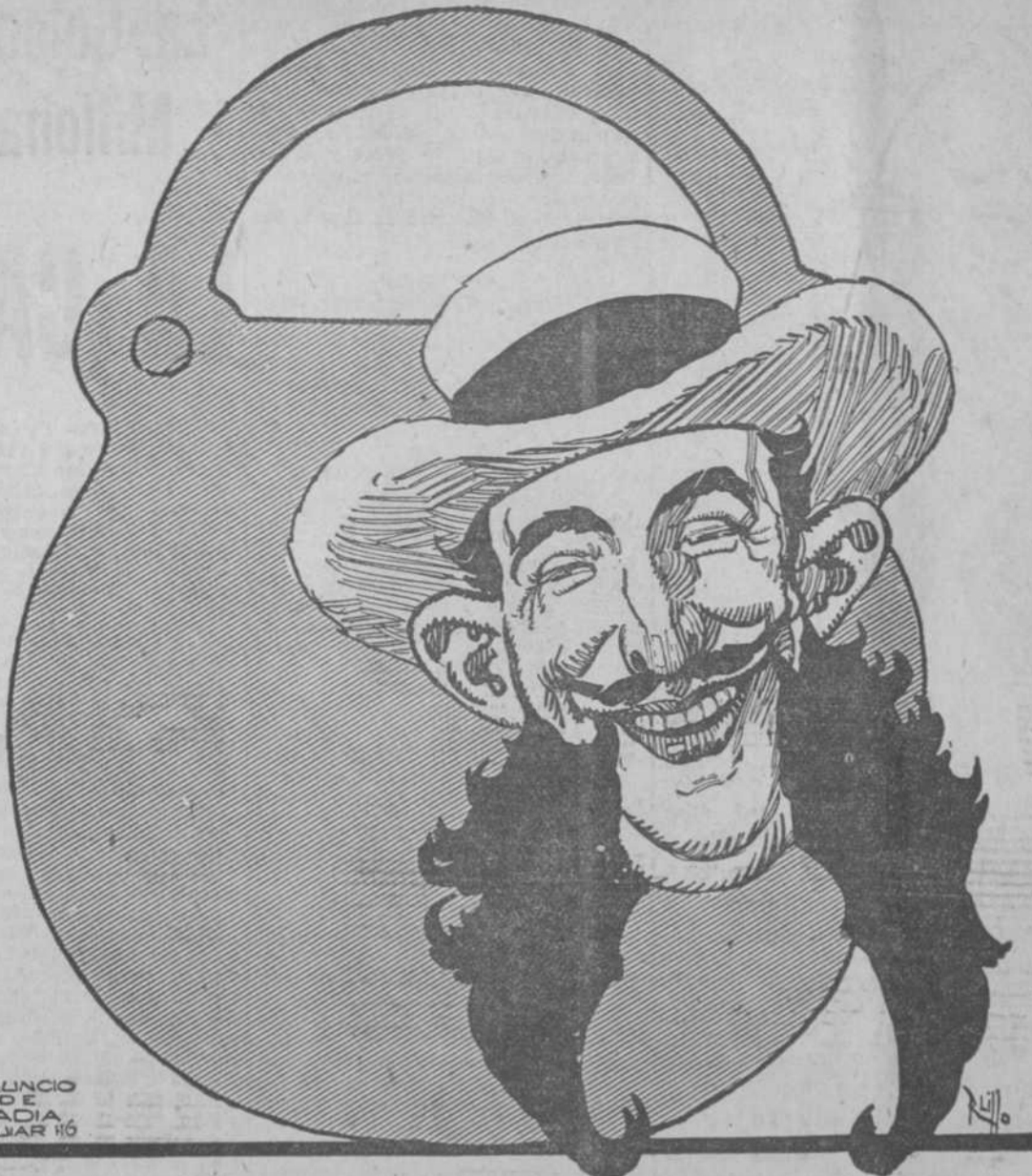
ANUNCIO DE VADIA AGUJAR 16

En fin: los obreros de las fábricas, hambrientos de otras doctrinas no le escucharon y así solo se preocupaban de obtener más salario y menos duración en la jornada de trabajo.