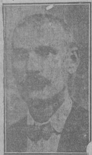
Señor Director de LA MARINA.