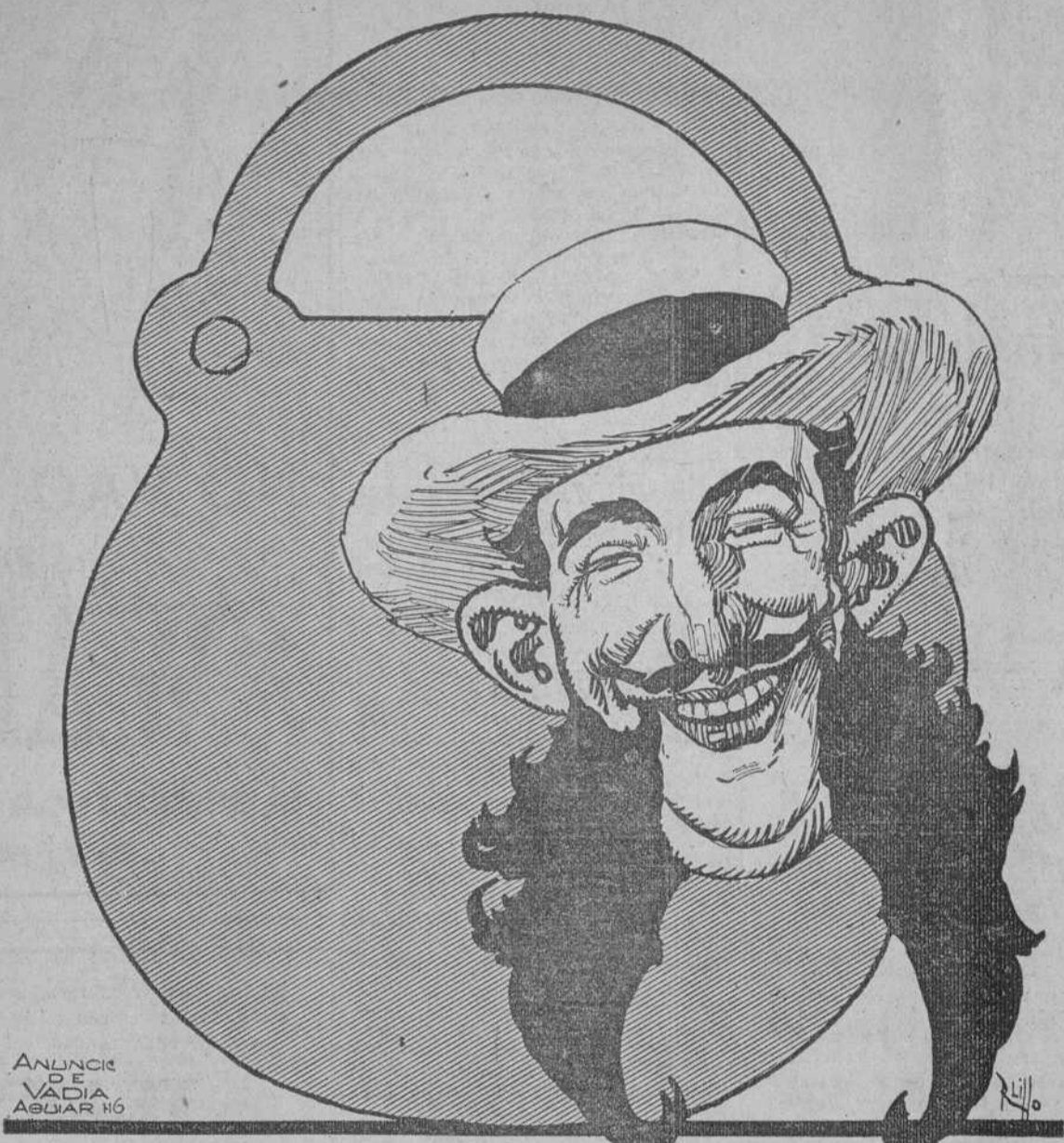
ANUNCIO DE VADIA AGUAR N.º 10

ROPA BLANCA JABON CANDADO Pídale en la bodega de la esquina.