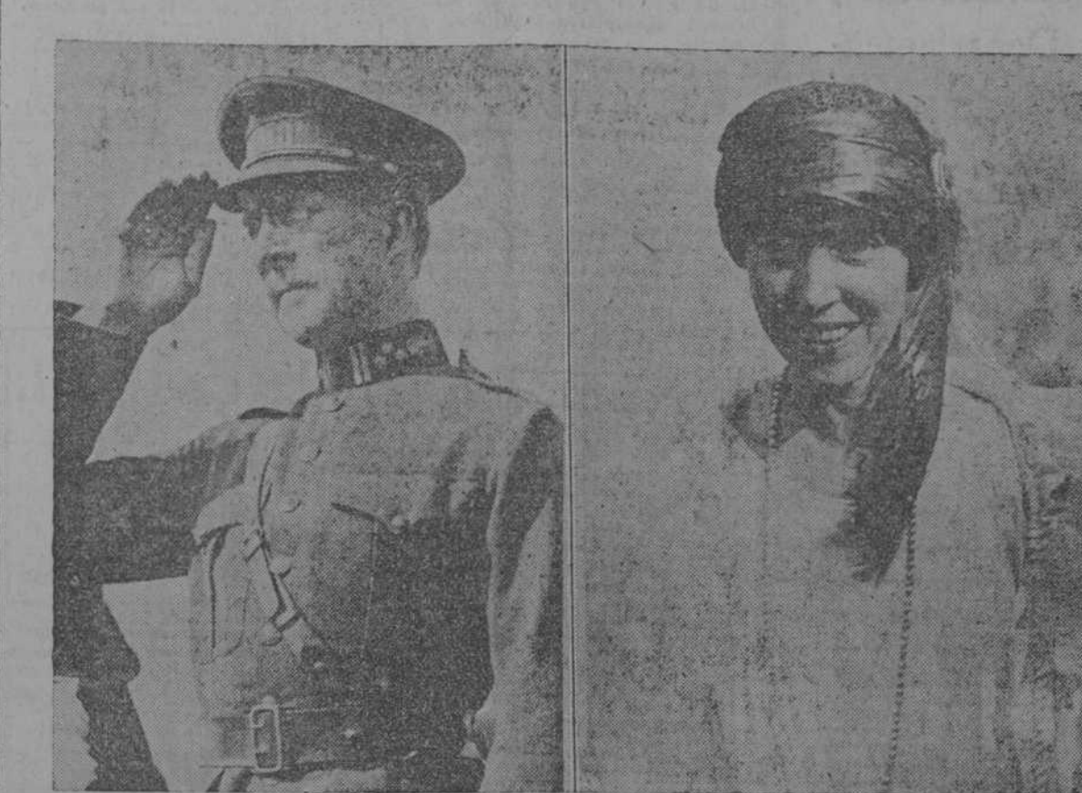
New York, Octubre 24.—El Rey Alberto de los belgas y la Reina Isabel llegaron hoy a New York. La llegada ha completado un viaje redondo de 8,599 millas al través del continente realizado en veinte días.