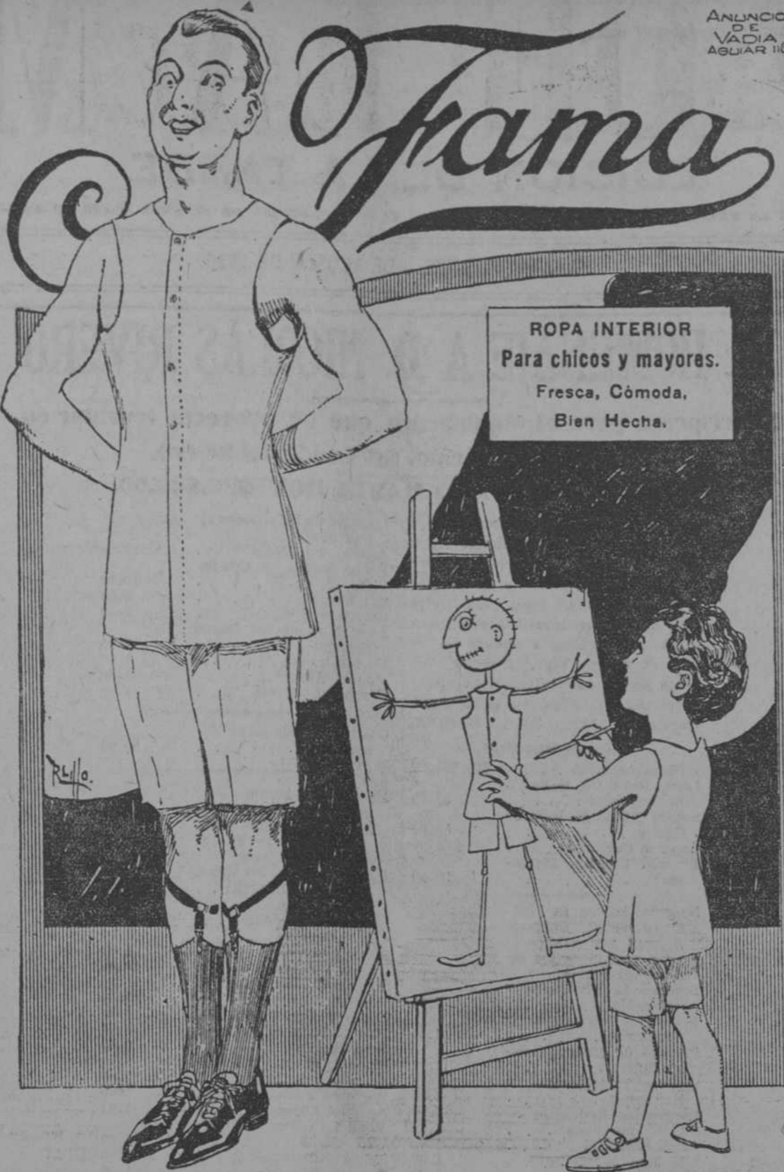
Fabricada por Garcia Vivanco y Ca., Sucesores de Gutiérrez Cano y Ca. Mural 107, Habana.