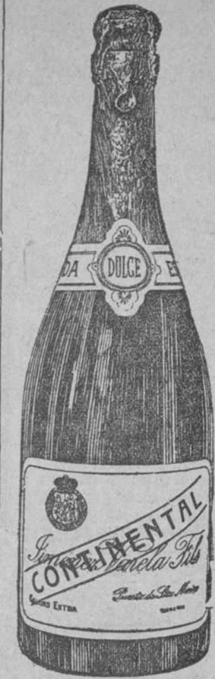
ANUNCIO DE VADIA AGUIAR 16

PIERROT El cigarro que Enamora G. del Peso y Cia