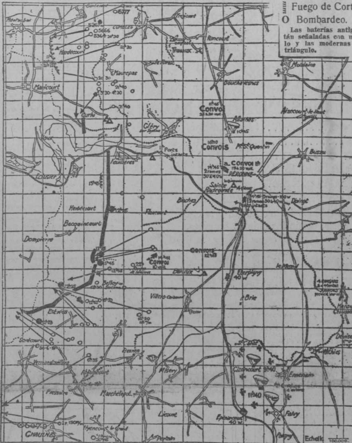
Mapa del distrito de Peronne hecho por los aviadore

Las baterías antiguas están señaladas con un círculo y las modernas con un triángulo.