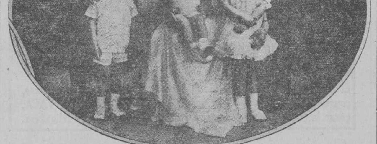
Los hijos de los Reyes de España a por orden de edad son: Don Alfonso, Príncipe de Asturias; Príncipe don Jaime, Princesas doña Beatriz y doña Cristina y Príncipes don Juan y don Gonzalo.