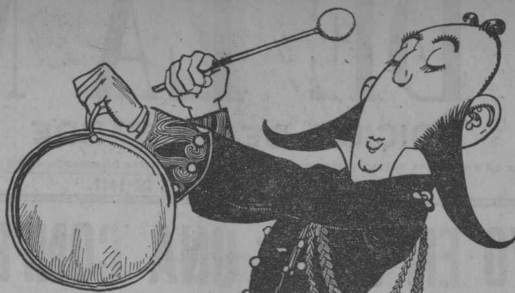
ANUNCIO DE VADIA AGUIA 116

lén, puedo enviarlos a los Estados Unidos; me sobran recursos para un internado en Cuba o fuera de Cuba, y sin embargo los tengo confiados al maestro tal y a la maestra cual, en aulas sin bastante higiene, sin pupitres, con libros deshechos por la suciedad y el uso, porque maestra y maestro, aunque aprobados por un tribunal incompetente en cierta sala de exámenes de provincias, me los cubanizan y educan mejor que en Belén, que en Saint John, que en los más afamados planteles del mundo donde no son cubanos los profesores. ¿Qué va! Cansado estoy de ver hijos de maestros educándose en escuelas de barrio; cansado estoy de ver hijos de funcionarios técnicos, en internados de escuelas religiosas. No