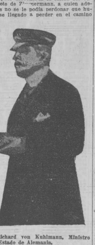
Richard von Kuhlmann, Ministro de Estado de Alemania.