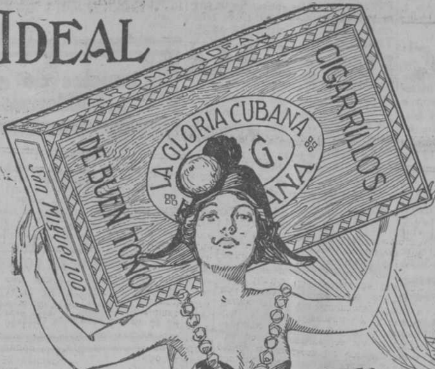
ANUNCIO DE VADIA AGUIAR 116

Su aroma delicada y exquisita, tiene una embriagadora atracción.