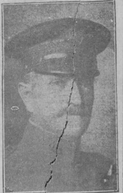
Mayor General de los Estados Unidos, John J. Pershing, comandante en jefe del Departamento de Tejas y al que se le supone como designado para mandar las primeras fuerzas americanas que han de ir a luchar al lado de los aliados.