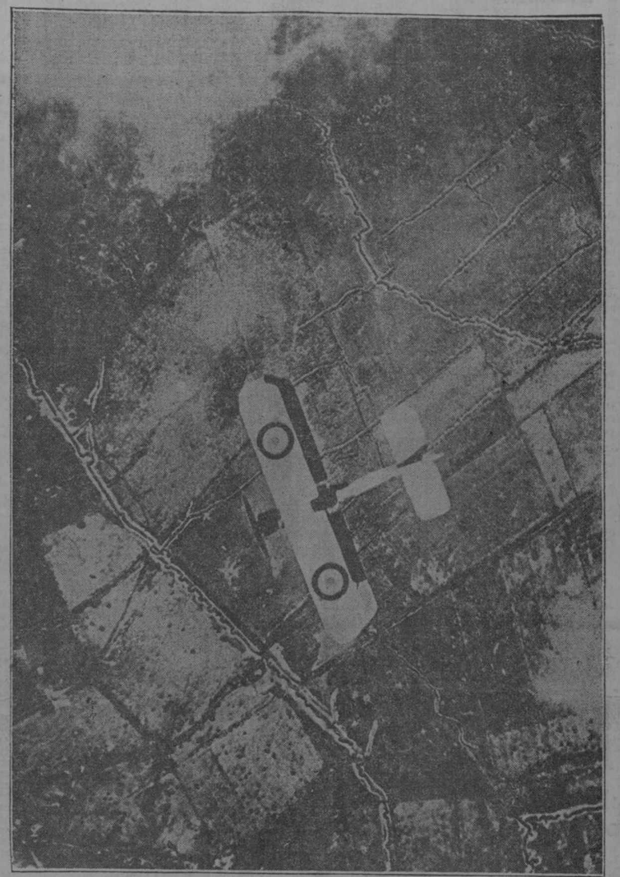
Trincheras alemanas fotografiadas por un aviator inglés, desde una altura de tres mil pies. Salí en la fotografía otro aeroplano inglés que volaba a menor altura.