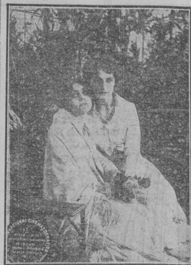
—¿Acaso amas al hombre a quien amo con toda mi alma?— —No, hermana mía; mi amor es sólo para Dios. Si llego a restablecerme seré Hermana de la Caridad y cada día rogaré por tu felicidad.

ficiente, en fin, cuanto cabe pedir a un cantante que, siendo "humano" es "divino", reveló anoche el gran Stracciari ante los dilettanti habaneros, ansiosos de apreciar sus méritos artísticos.