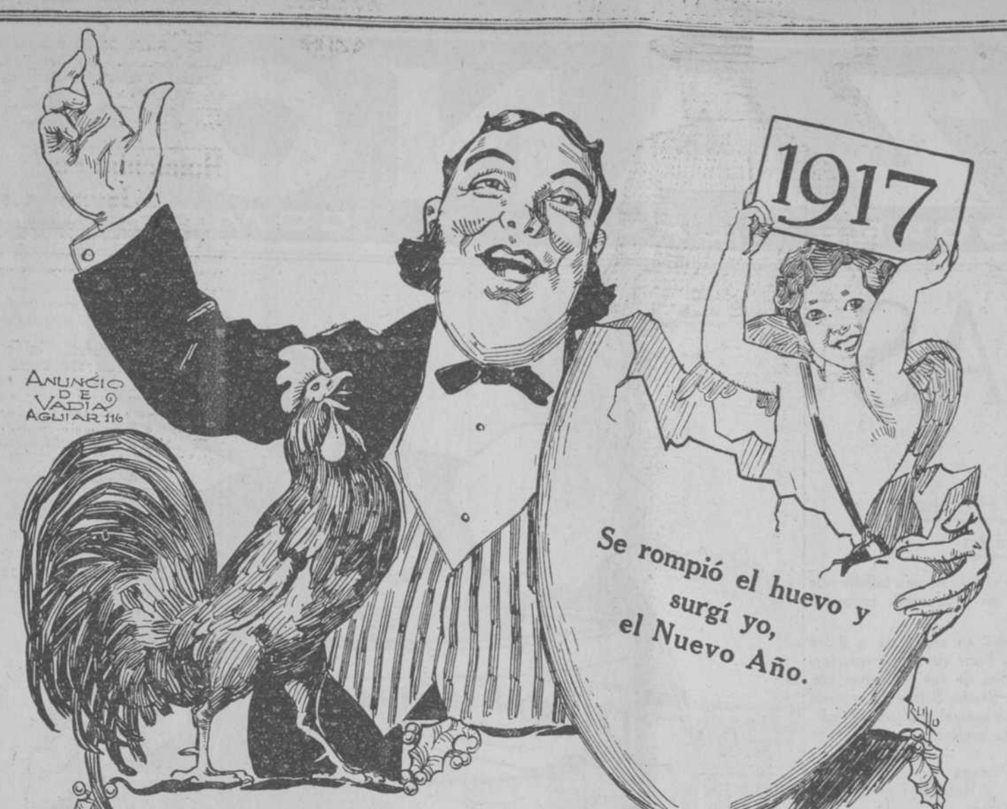
ANUNCIO VADIA AGLIAR 116

PERFUMERIA, SEDERIA, TEJIDOS Y CONFECCIONES.