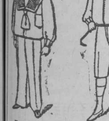
Traje Marinero Alpaca $9.10 Traje Marinero Cashmir $2.75 Ruso Cashmir $7.50

Se hace cargo de los siguientes trabajos: marcas y patentes de invención, Registro de Patentes, Dibujos y Clichés de marcas, Propiedad Intelectual, Recursos de apelación, Informes periciales, Consultas, GILDA, Registro de marcas y patentes en países extranjeros y de marcas internacionales.