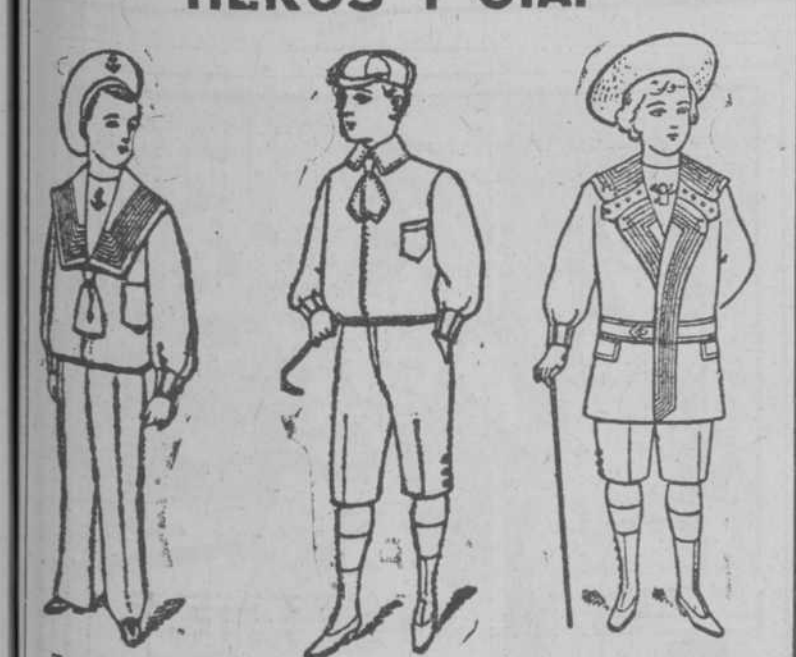
Traje Marinero Alpaca $9.10 Traje Marinero Cashmir $2.75 Ruso Cashmir $7.50

Haga una visita a nuestro "Gran Salón de Conexiones", y en el mismo encontrará todo lo que necesita para vestir a sus niños con elegancia y economía.