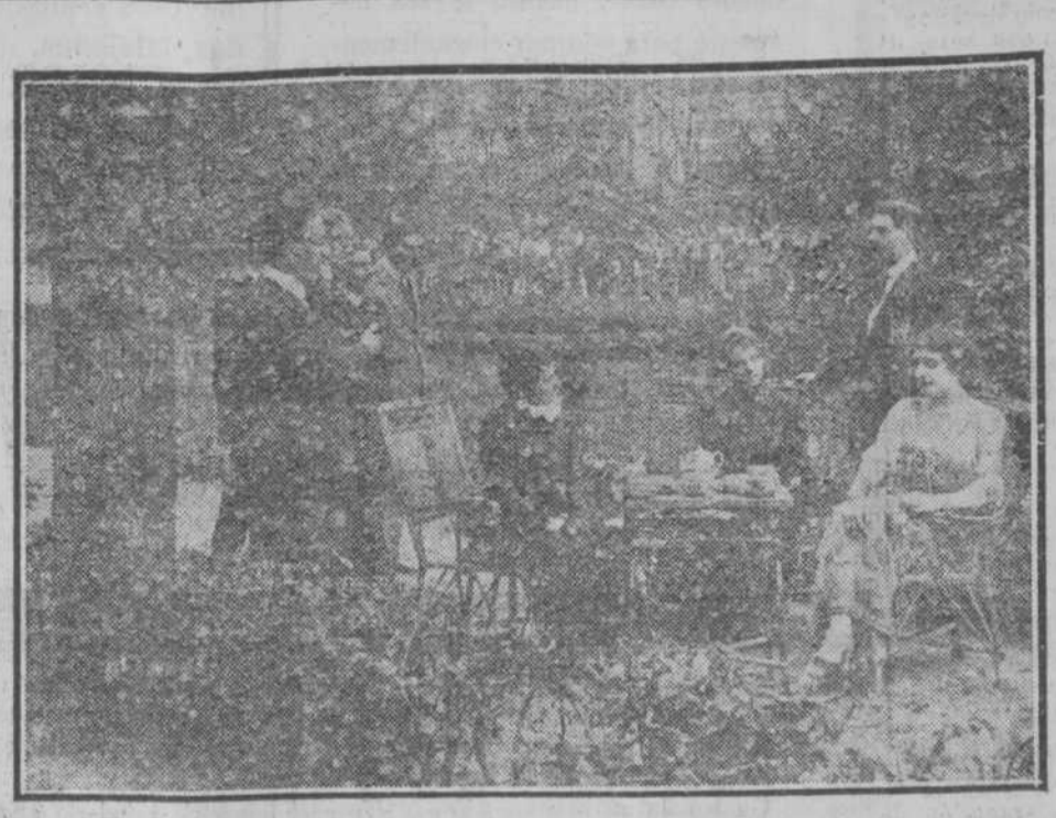
El cataclismo financiero que amenaza reducir a la miseria a los padres de Magdalena, hace que ésta termine las relaciones con el hombre a quien ama con todas las potencias de su alma y de su sangre, y acepte el amor de un hombre que le es completamente indiferente.

15.-MISS CLARA: Linda americana que colgada de los dientes, a una altura respetable, hace un acto de volar y una muy bonita.