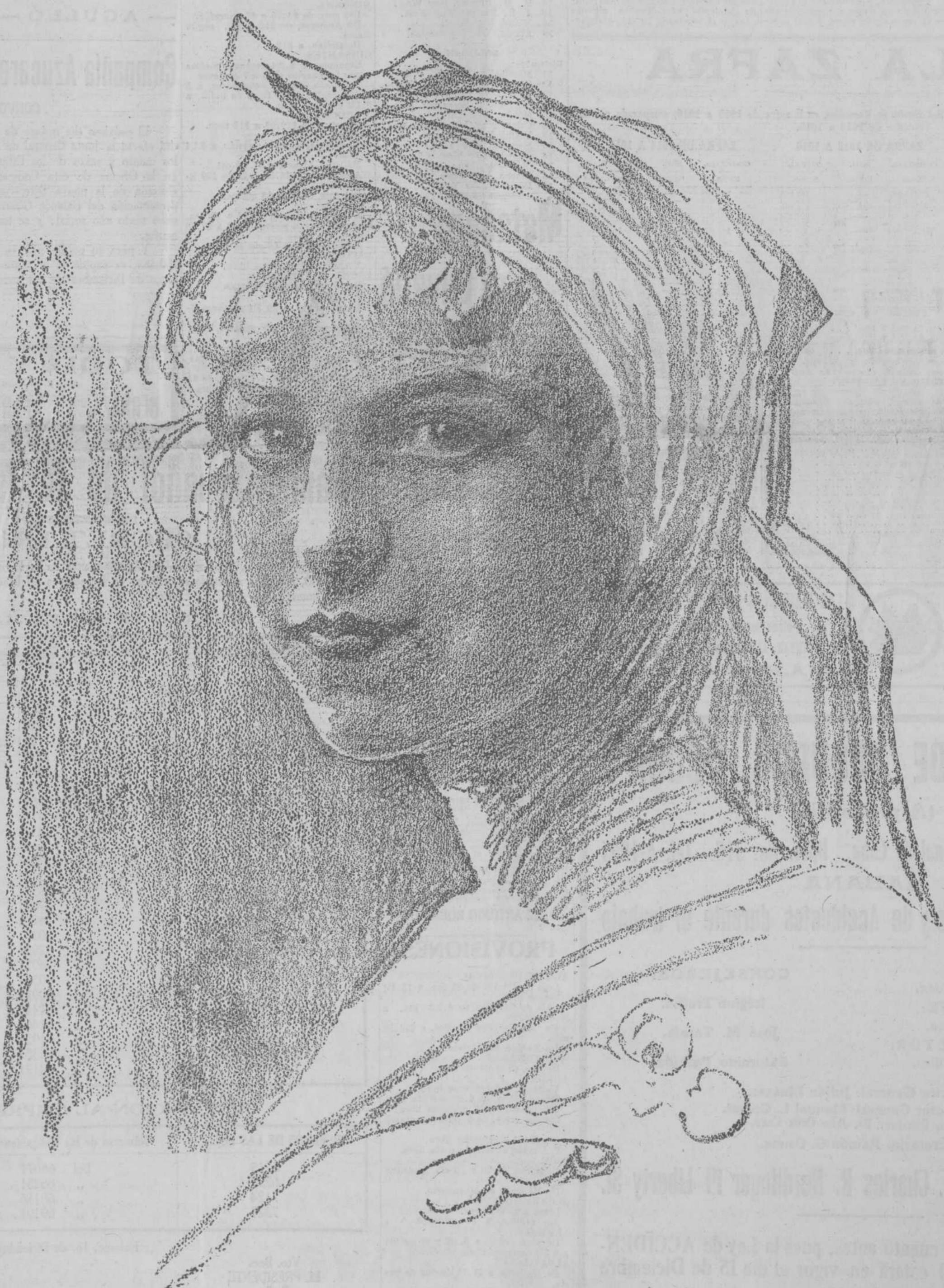
TIPO ESPAÑOL. | Mujer de Villaviciosa. |