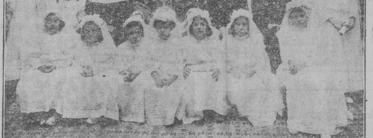
ALUMNAS DEL COLEGIO QUE ASISTIERON A LA SOLEMNE PROFESION DE VOTOS