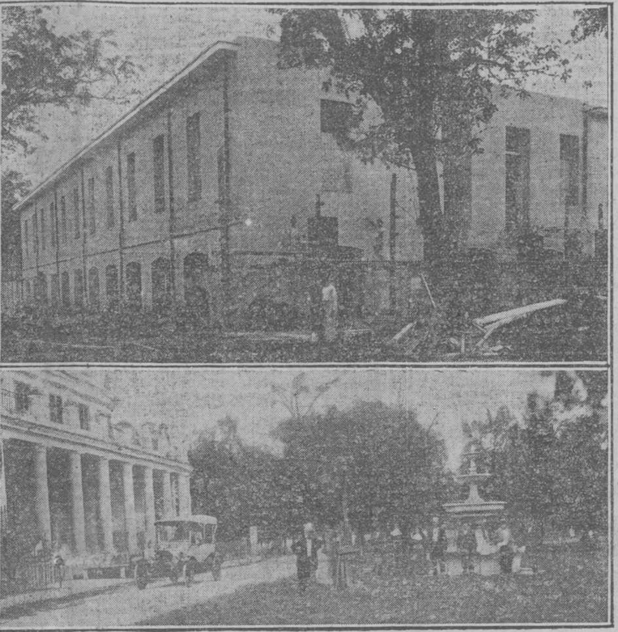
La hermosa capilla del asilo de Santovenia.—En la parte superior una vista de las obras que se realizan en el Asilo de Ancianos desamparados.—En la parte inferior un aspecto de los hermosos jardines del Asilo.

No, en este mundo no hay vencedores ni vencidos. En este mundo hay hombres con suerte y hombres desgraciados, en todas las manifestaciones de la vida.