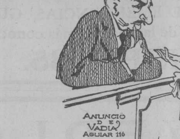
ANUNCIO VADIA AGUIAR 116