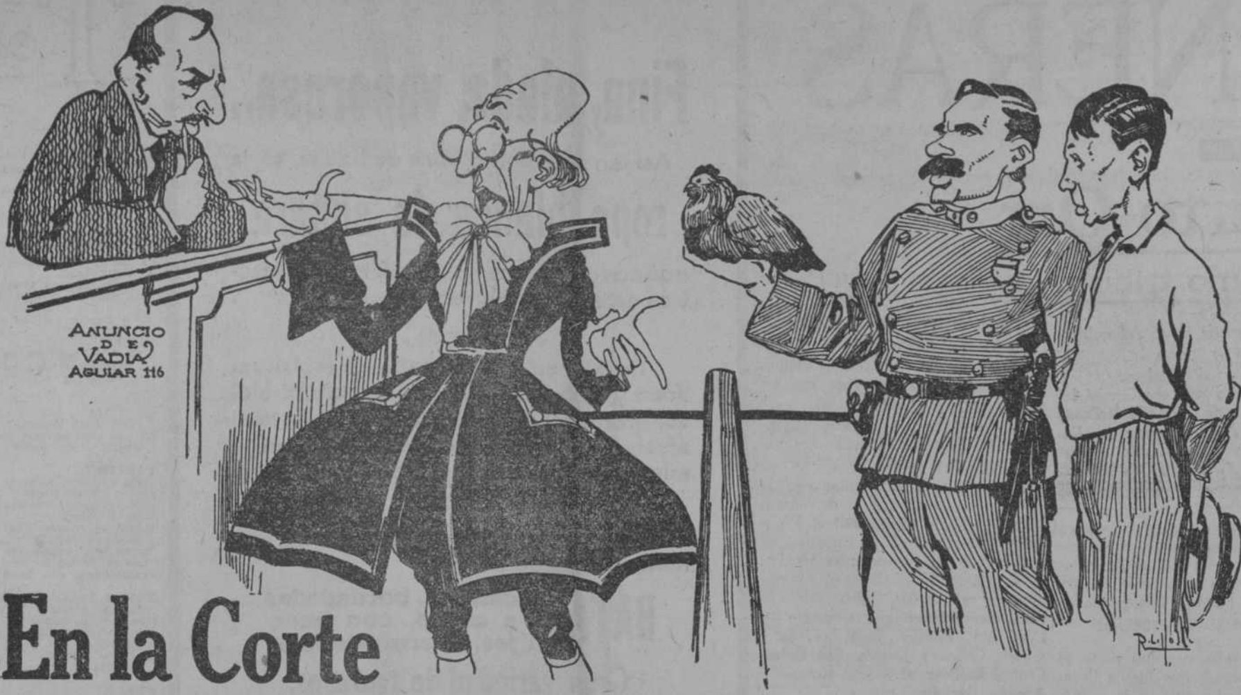
ANUNCIO D E VADIA AGUIAR 116