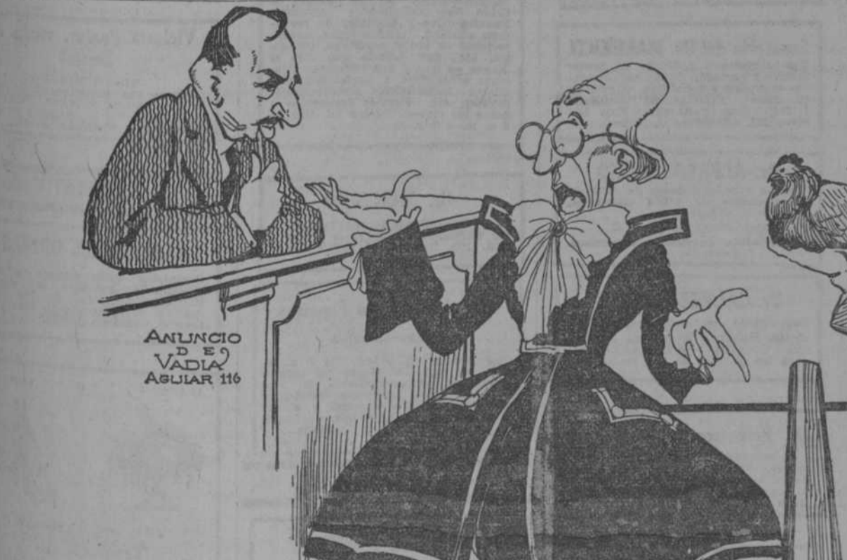
ANUNCIO D E VADIA AGUIAR 116

EL CORRESPONSAL Suscribiremos al DIARIO DE LA MARINA y anéndice en el DIARIO DE LA MARINA