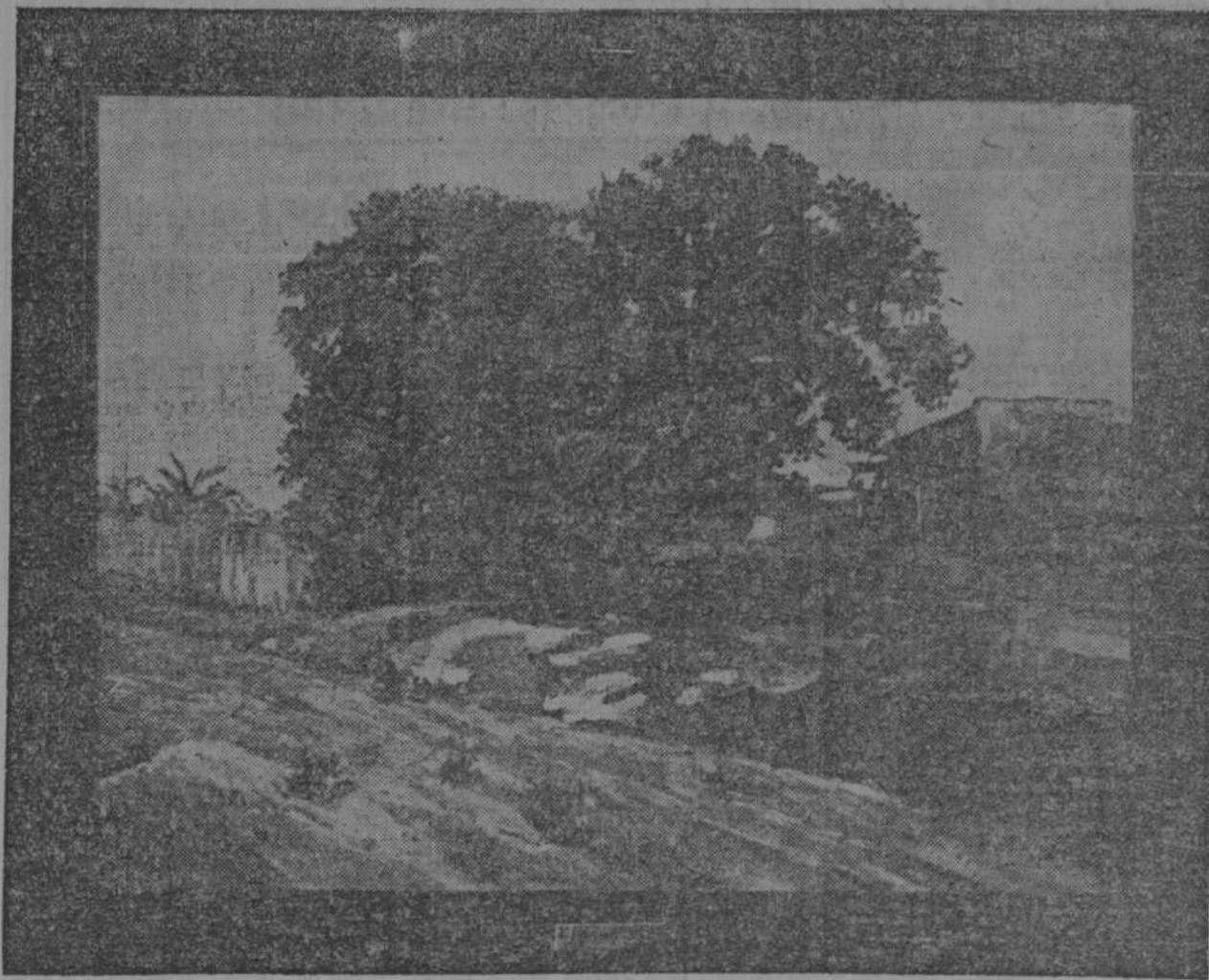
"La Choca de la Leca", por Hipólito Canal y Ripoll. Primer premio de paisajes.