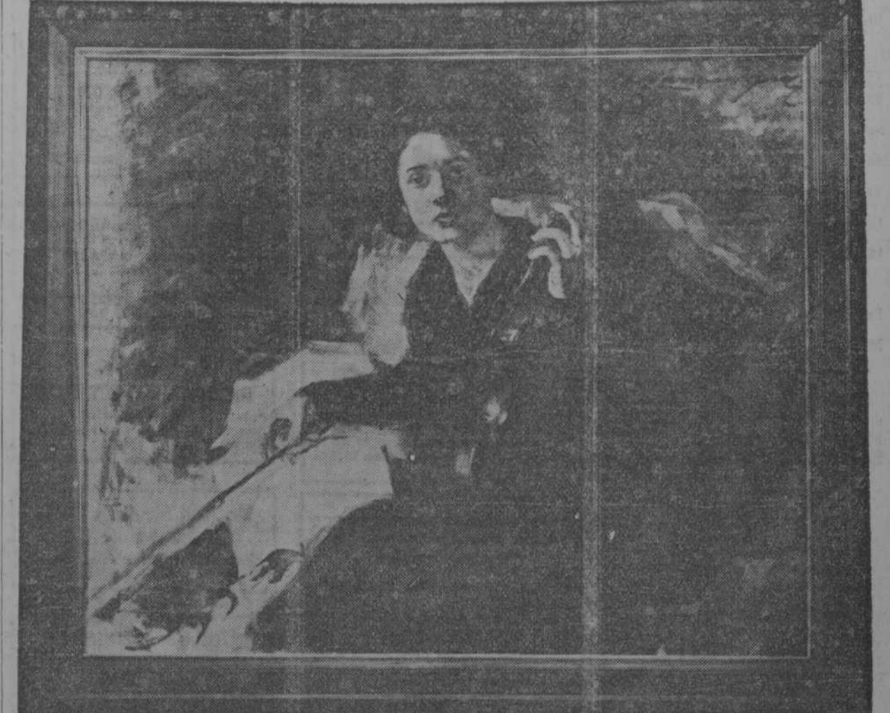
"Violinista" por la señora La Marque, cuadro—no premiado—de 108 más notables en el concurso.

(VIENE DE LA PRIMERA) Es, en verdad, todo lo que nos sugirió ver la obra premiada. Pintura: Paisaje. Es esta la sección más interesante de todas las formadas por las obras presentadas al concurso de la Academia Nacional.