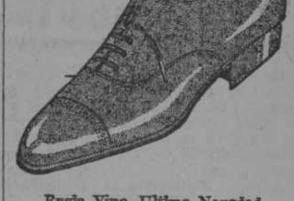
Rusia Vino. Última Novedad.