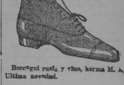
Borcguí rusa y vino, horma M. A. Última novedad.