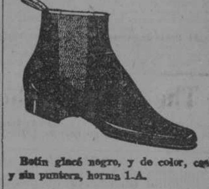
Botín glacé negro, y de color, con y sin puntera, horma I.A.