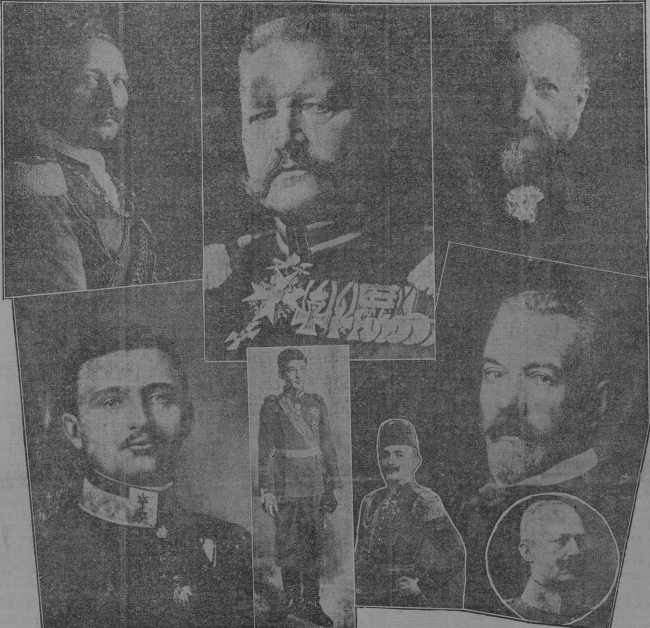
LA CONFERENCIA DE BERLIN.—La entrada de Rumania en la guerra hizo necesaria esta conferencia, a la que asistieron Delegados de todos los países aliados de Alemania. Figuran en este cambio de impresiones, donde se decidió el nuevo curso de la guerra, los siguientes altos personajes, que en este grabado recogemos: De izquierda a derecha: Emperador Guillermo de Alemania, Guillermo II; General Von Hindenburg, Jefe del Estado Mayor Alemán; Fernando I, Rey de Bulgaria; Archiduque Carlos Francisco José, heredero de la Corona de Austria; Enver Paschá, ministro de la Guerra de Turquía; Von Bethmann-Hollveg, Canciller Imperial de Alemania, y General V. Ludendorff, Cuartelmaestre general. El retrato del Principe Orris es un complemento de esta información.

Pidiendo local para las actuaciones. Exhortos diligenciados. - Pruebas. - Dos condenados a Presidio.