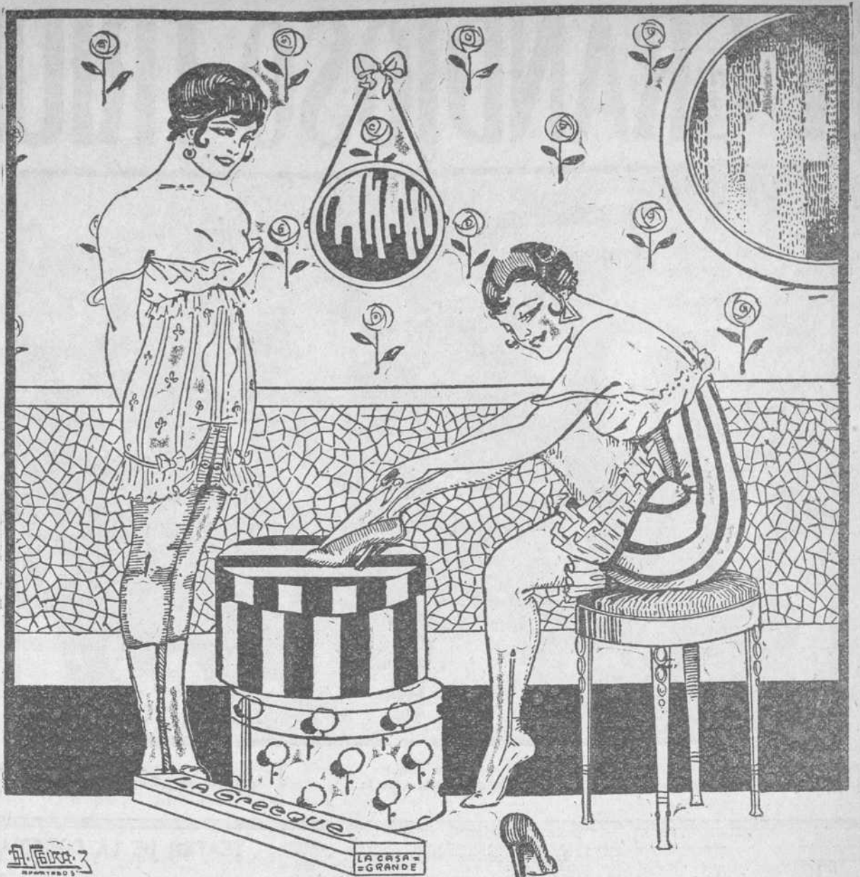
—Mi sistema para aumentar las amistades consiste en recomendar el corsé LA GRECQUE. —Yo casi siempre tengo que conformarme con que me agradezcan la intención, porque ya lo usan y saben de sus excelentes cualidades.