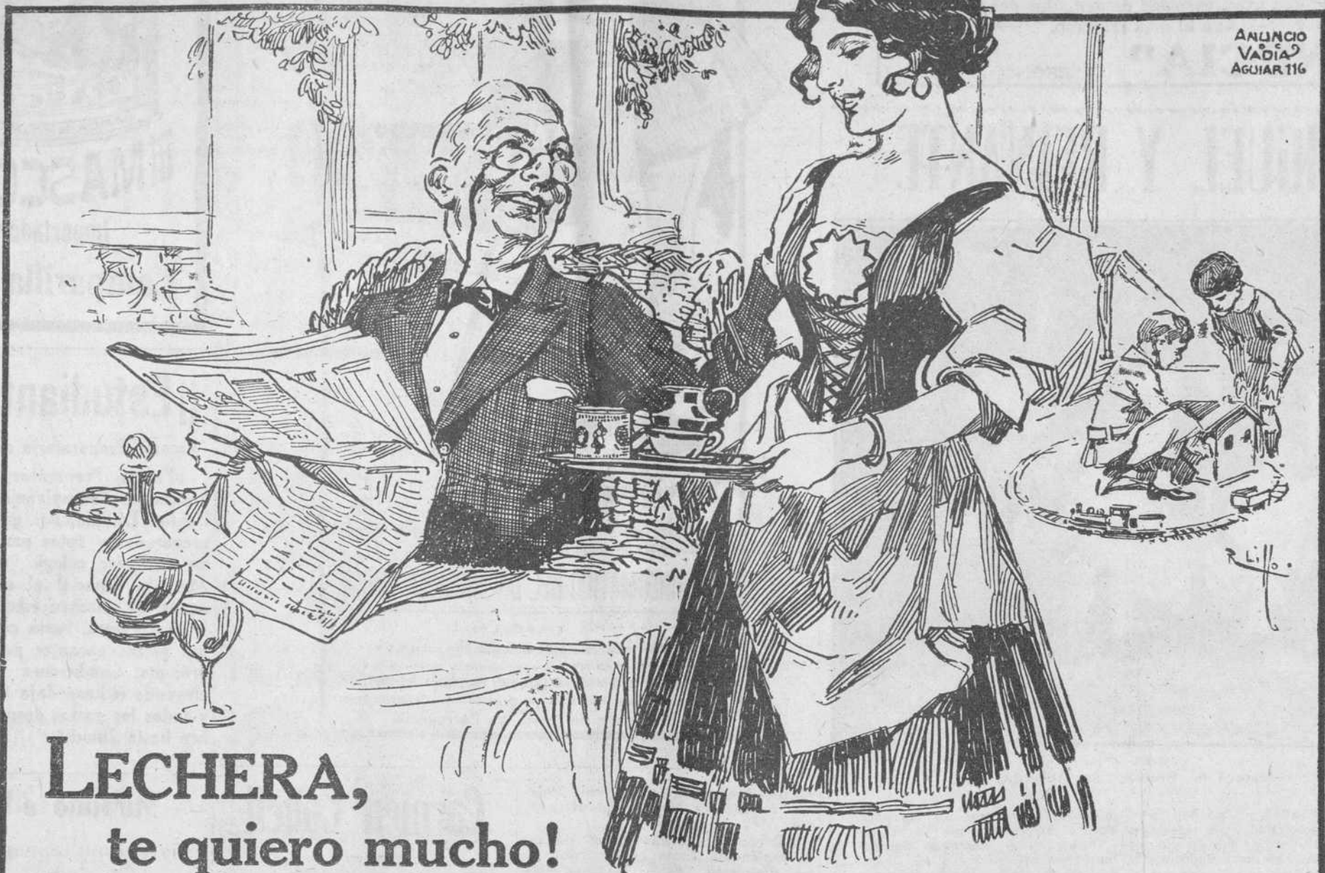
ANUNCIO VADIA AGUIAR 116