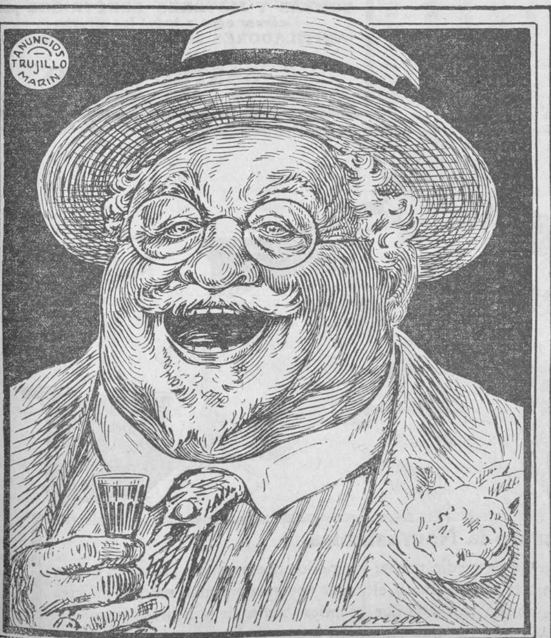
ANUNCIOS TRUJILLO MARIN

El mejor Licor que se conoce. Desconfíen de las imitaciones.