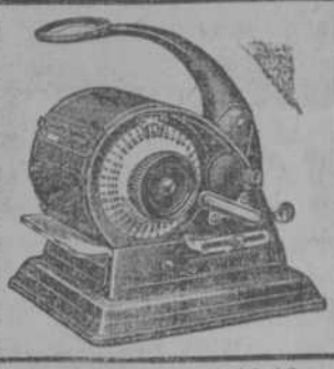
C2947 alt. 110-12.