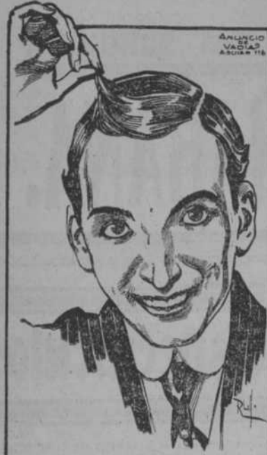
Ni Una Cana y Antes Tena Muchas.